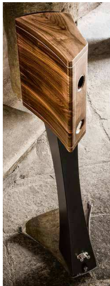
Umístění terminálů v dolní části stojanu je nejen elegantní ale i velmi praktické.