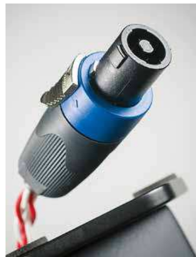
Speakon vede filtrovaný signál ze stojanu do soustavy